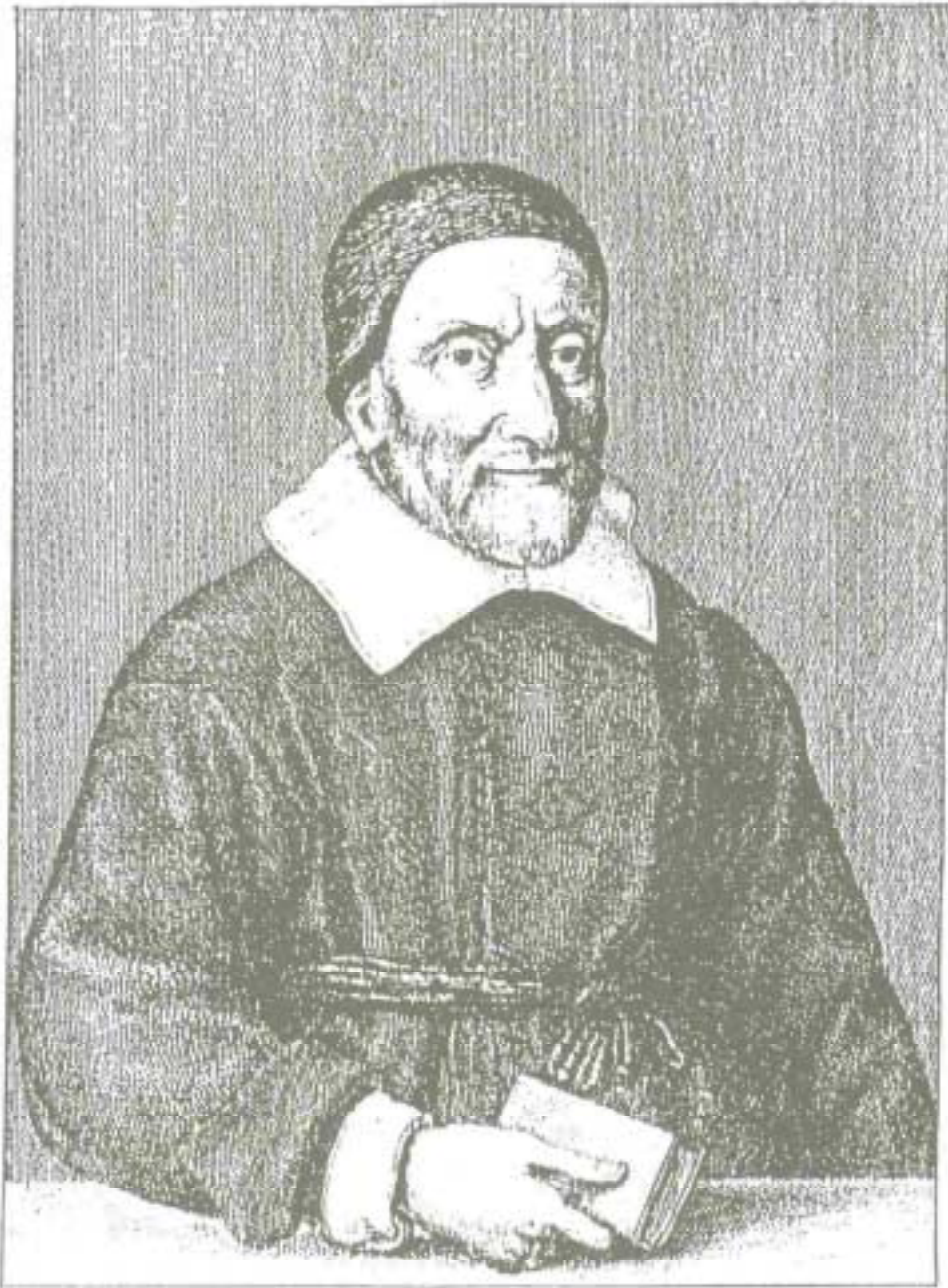
GULIELMUS OUGHTRED ANGLVS. 94 ex Academia Cantabrigieusi. Aetate 75: 1646.