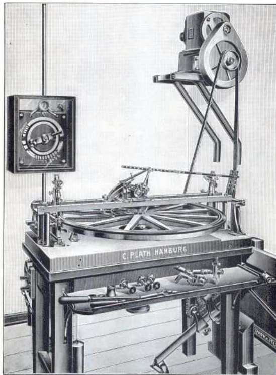
Elektrische Kreisteilmachine aus dem Jahre 1899

Bereits 1862 fertigt Johann Christian Dennert eine Längenteilmachine an. Carl Christian Plath kauft 1865 eine Kreisteilmachine. Die folgende Abbildung zeigt eine Kreisteilmachine von C.Plath aus dem Jahre 1899.